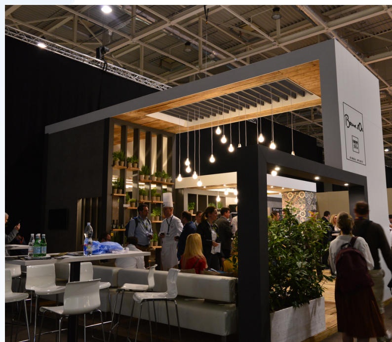
▼ ITU 2019 - Leaders' Space