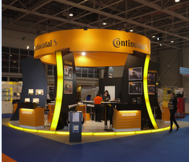
▲ 3M, Continental, Inno Robotics