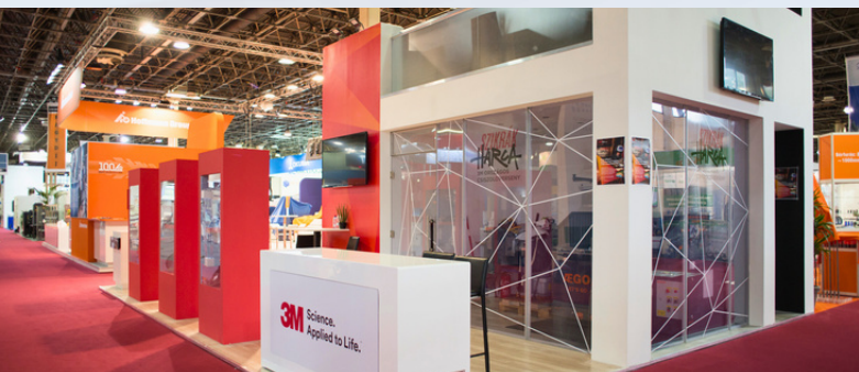
World of Coffee 2017 ▼