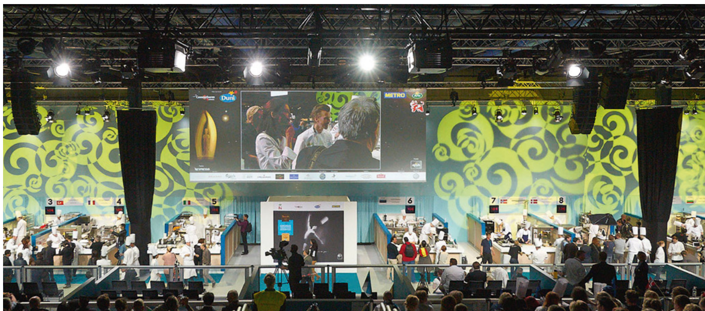
Bocuse d'Or Europe 2014 - Stockholm